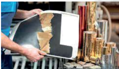
Lavorazione plastica e delle pellicole