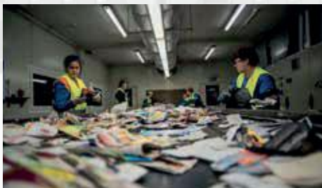
Rifiuti misti (smaltimento e riciclaggio)