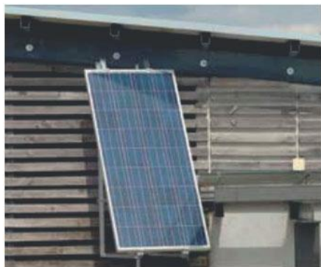
Impianti fotovoltaici per le case (magnitudo 4-5kWh)