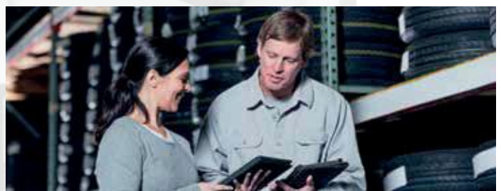
Produzione, lavorazione e stoccaggio della gomma, compresi i pneumatici.