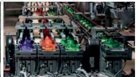
Produzione, lavorazione, e stoccaggio di materie plastiche. Premix LI-ION MB protegge anche i piccoli portacarichi.