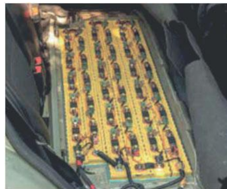
Punti di ricarica delle batterie o aree di stoccaggio